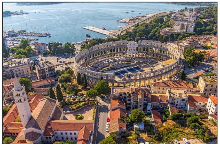
L'amphithéâtre de Pula