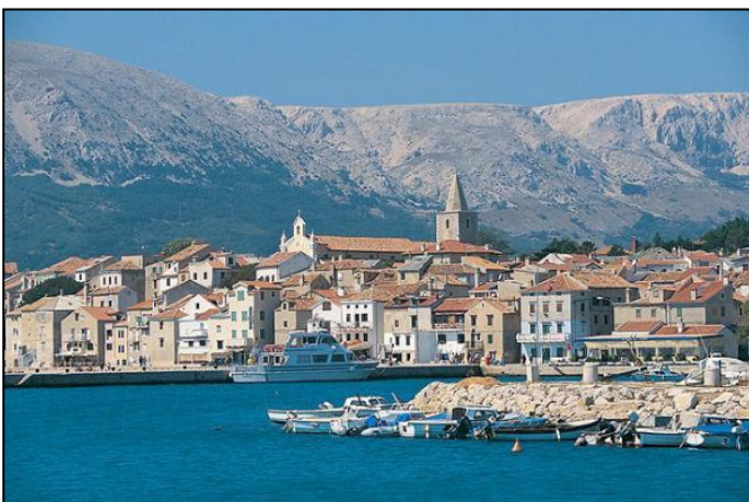
L'île de Krk