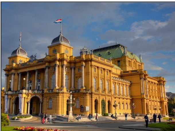
Le théâtre national de Zagreb